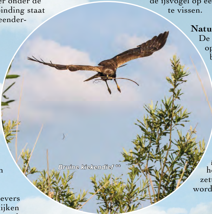
Bruine kiekendief **

Het gebied is lopend te bereiken via de Aderoute. Hierlangs staat een prachtige uitkijkpost. Het gebied zelf is voor het publiek niet vrij toegankelijk. Op aanvraag geeft Stichting Jacobus voor groepen rondleidingen. Bent u geïnteresseerd in een rondleiding of overnachting? Kijk op www.stichtinghanepoel.nl voor de contactgegevens.