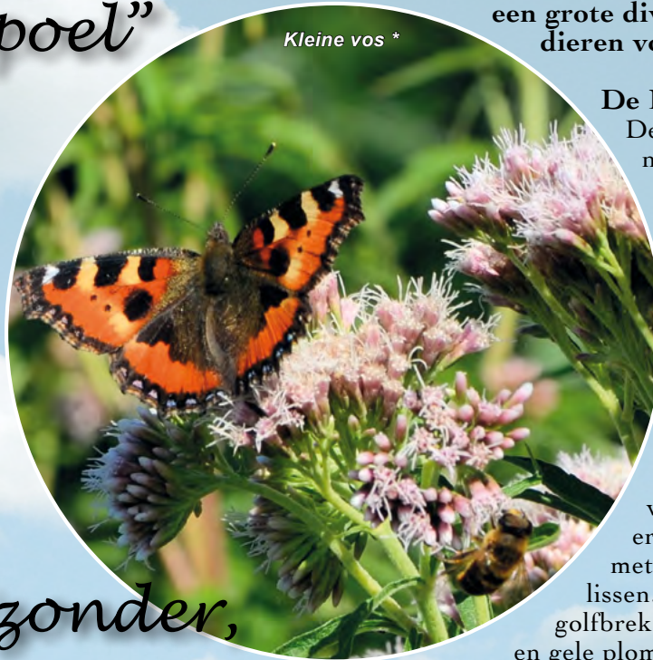
Kleine vos *

Stichting Jacobus "Natuurgebied Hanepoel" is in 1998 opgericht en beheert en onderhoudt de Hanepoel en de Leendert de Boerspolder. Deze gebieden vormen een prachtig aaneengesloten natuurgebied met grote landschappelijke waarden. Er komt een grote diversiteit aan planten en dieren voor.