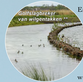
Golfslagbreker van wilgentakken **

De Leendert de Boerspolder was onderdeel van een oud polderlandschap en heeft al verschillende veranderingen ondergaan. Bij de drooglegging van het Haarlemmermeer is de helft van de polder verloren gegaan door de aanleg van de Ringvaart.